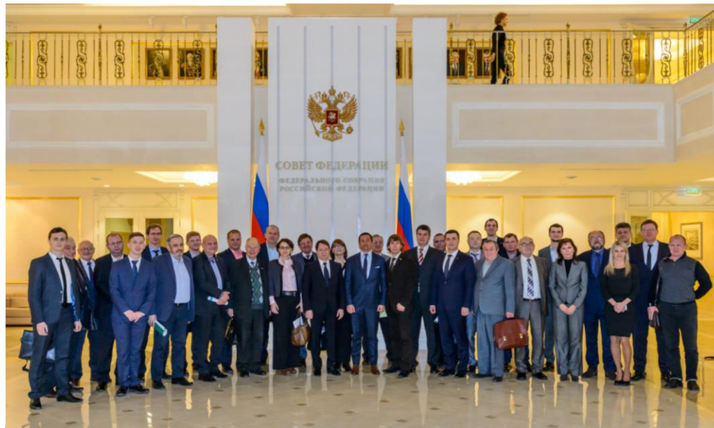
Парламентские слушания. Импортозамещение на примере производства систем отопления. Совет Федерации ФС РФ, декабрь 2016

По итогам 2023 года суммарная выручка предприятий-членов АПРО составила более 40 млрд. рублей .