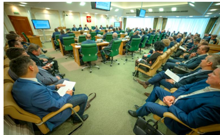
Круглый стол на площадке Совета Федерации. Обязательная сертификация радиаторов, фев 2018