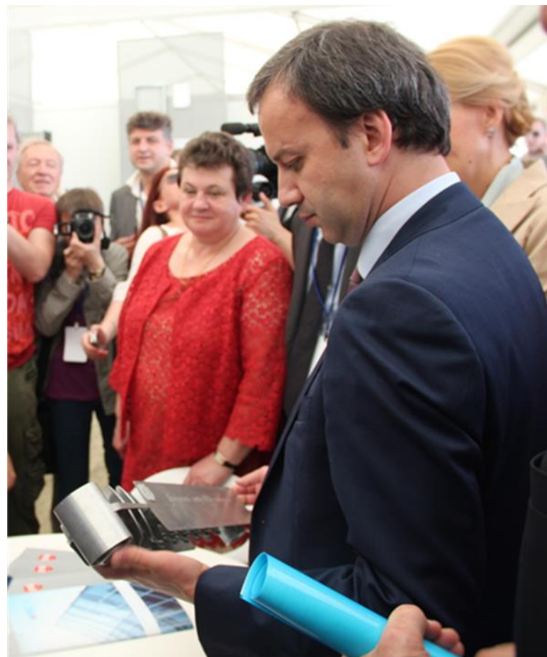
Презентация радиаторов отечественного производства Вице-Премьеру Правительства РФ А.В. Дворковичу Владимирский экономический форум, май 2015

Застройщики и стройгипермакеты стали размещать заказы на контрактное производство (ОЕМ) не на китайских и турецких, а на российских заводах