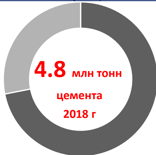
Незаконный оборот цемента в РФ

До введения обязательной сертификации доля тарированного контрафактного цемента на рынке России в частном потреблении достигала 40%.