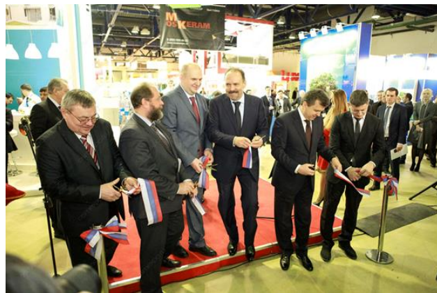
Министр строительства и ЖКХ РФ Михаил Мень

MosBuild (5–8 апреля, Москва, Экспоцентр www.mosbuild.com )